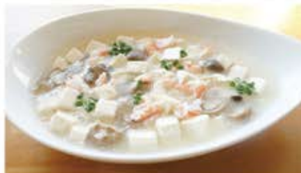
蟹と豆腐のXO醤煮込み

高根沢町産の大豆「里のほほえみ」を使用した、濃厚で甘みのある「雪花菜」手作りの豆腐を使用♪