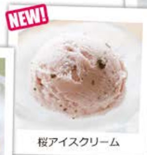
桜アイスクリーム