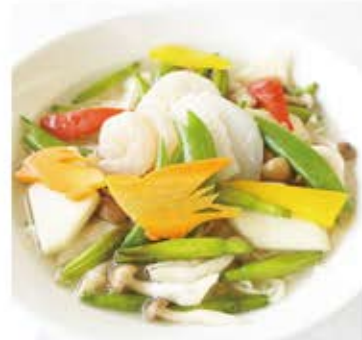
青海海鮮ラーメン (塩味)