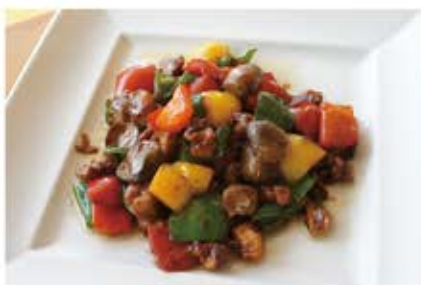
若鶏モモ肉と角切り野菜甘みそピリ辛炒め