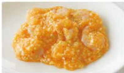
海老チリソース炒め