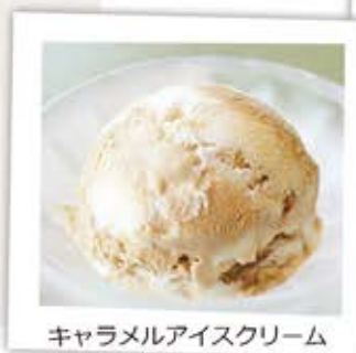
キャラメルアイスクリーム