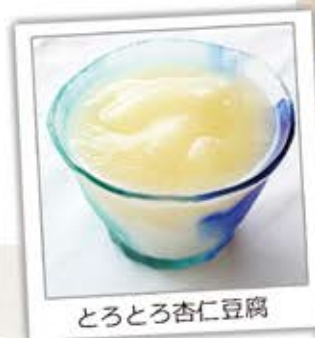
とろとろ杏仁豆腐