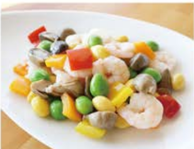
銀杏と海老のあっさり炒め