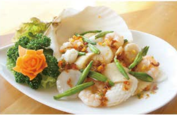
海老と帆立貝とイカのあっさりXO醤炒め