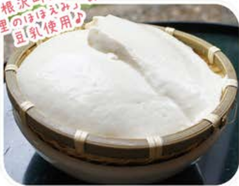
ざる豆腐 390 円 (税込 421 円) 雪花菜の豆乳を使いあやめで手 作り。お持ち帰り用もご用意で きます。