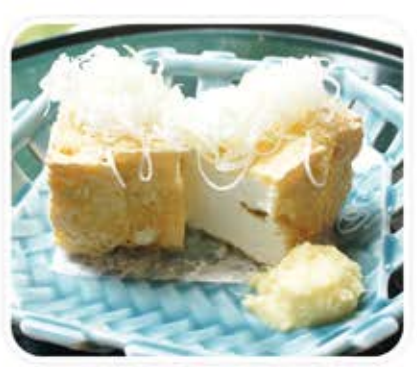
厚揚げ 490 円 (税込 529 円) きらずの手作り豆腐を 厚揚げにしました。