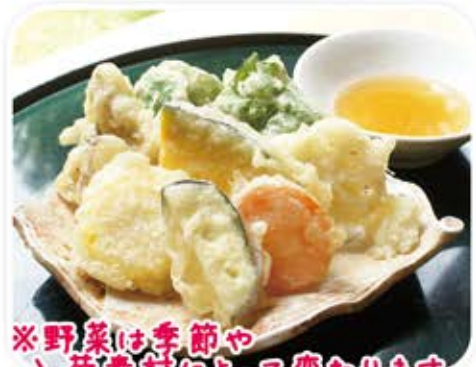
※野菜は季節や 入荷素材によって変わります。 季節野菜の天ぷら 600 円 (税込 648 円)