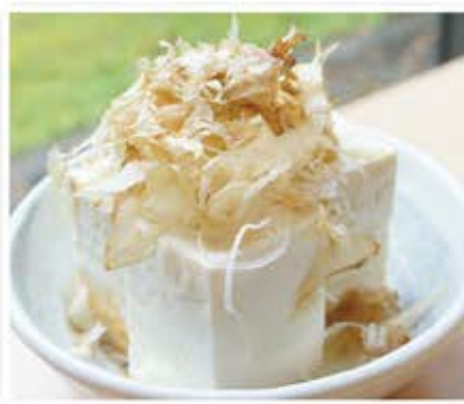
冷ややっこ 370 円 (税込 400 円) きらずの手作り豆腐を使用。